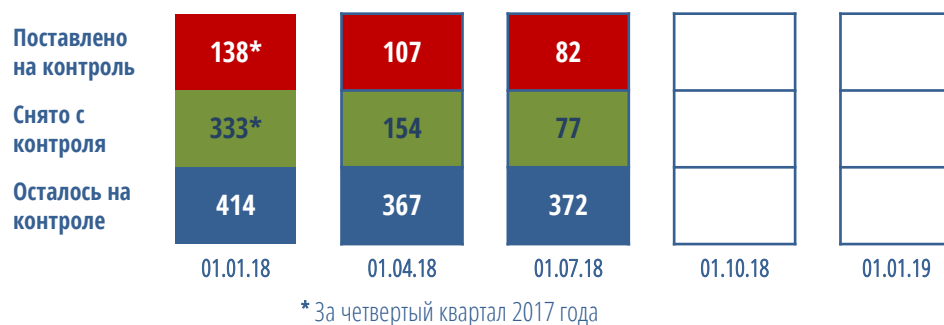
Диаграмма №4. Контроль качества домов (в разрезе федеральных округов)