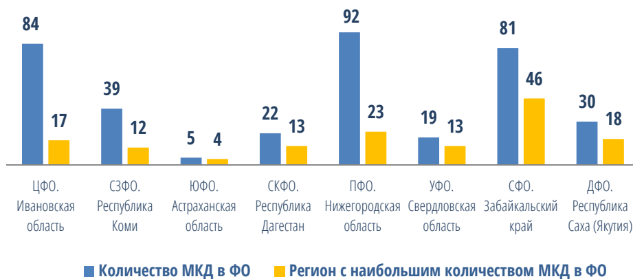
Диаграмма №5. Контрольные мероприятия (в разрезе федеральных округов)