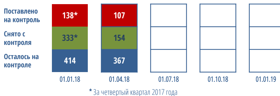
Диаграмма №4. Контроль качества домов (в разрезе федеральных округов)