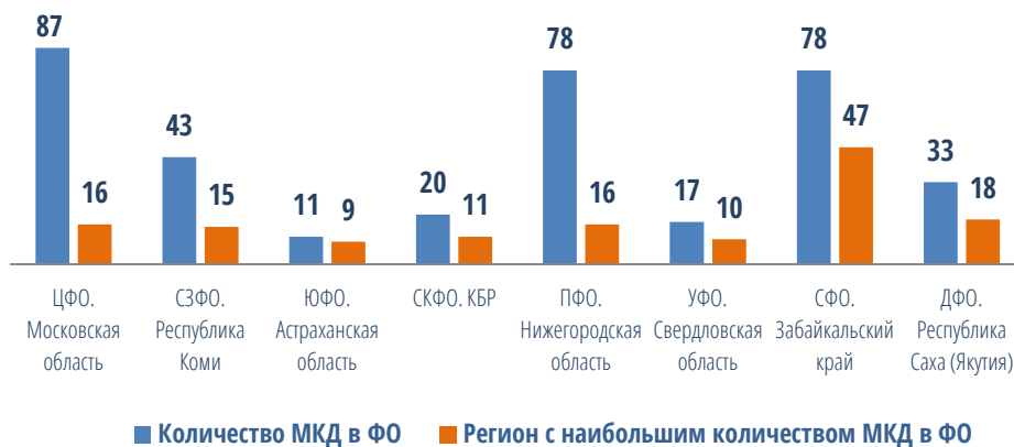
Диаграмма №5. Контрольные мероприятия (в разрезе федеральных округов)